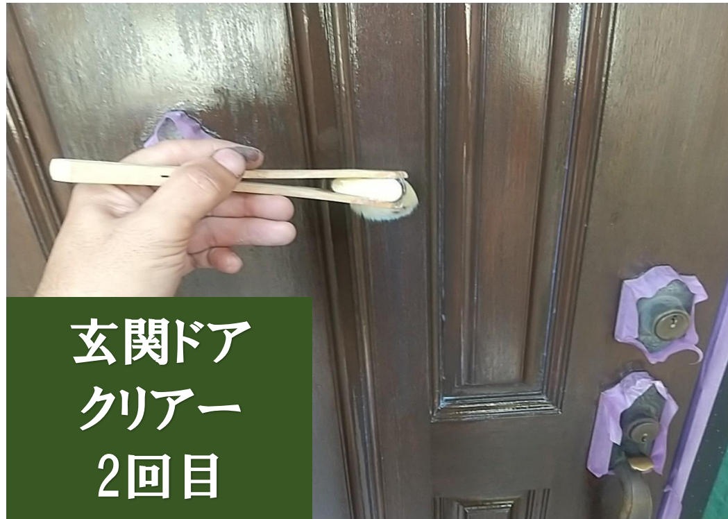
玄関ドア クリアー 2回目