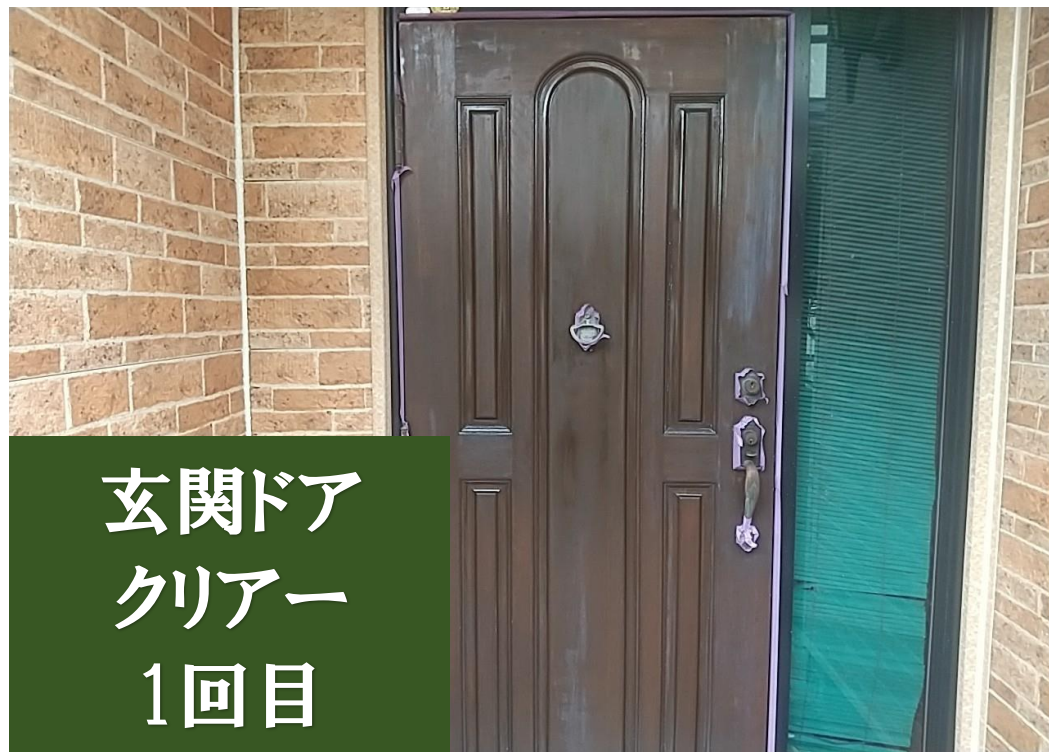
玄関ドア クリアー 1回目