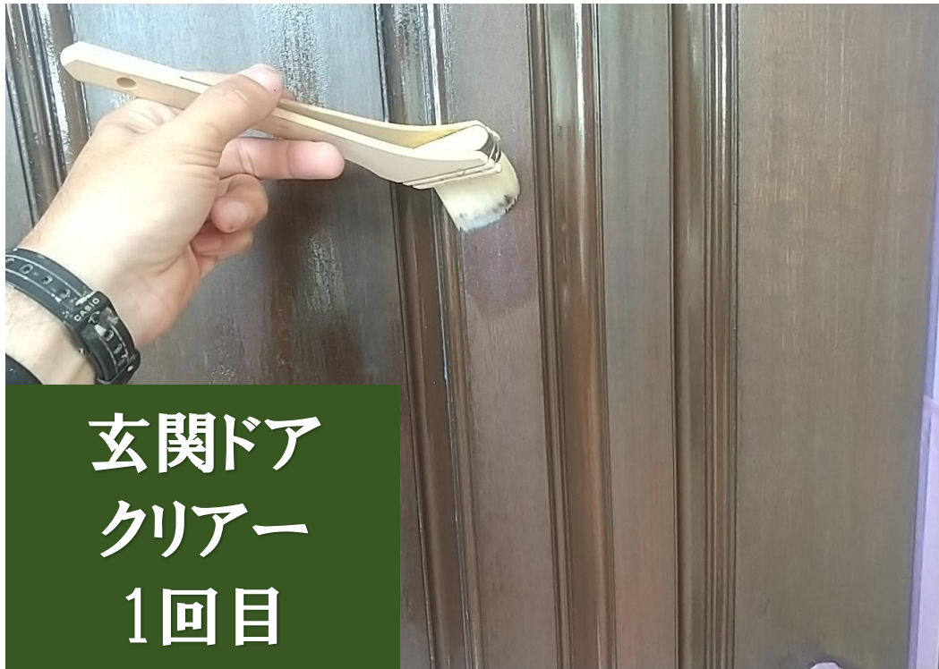
玄関ドア クリアー 1回目