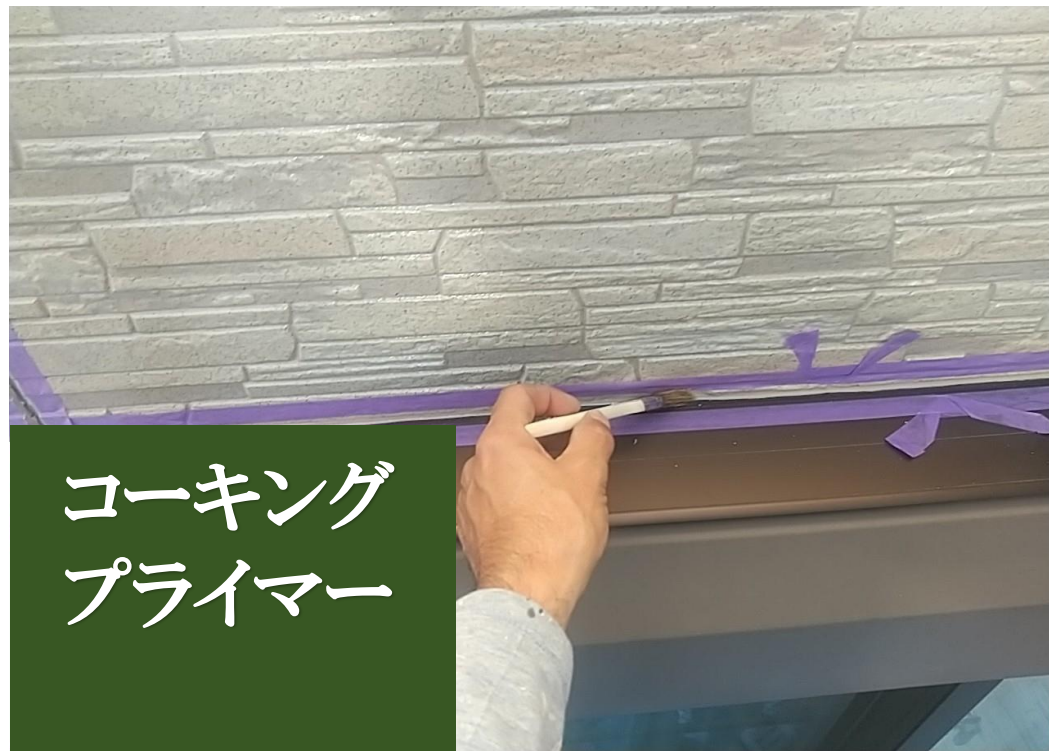
コーキング プライマー