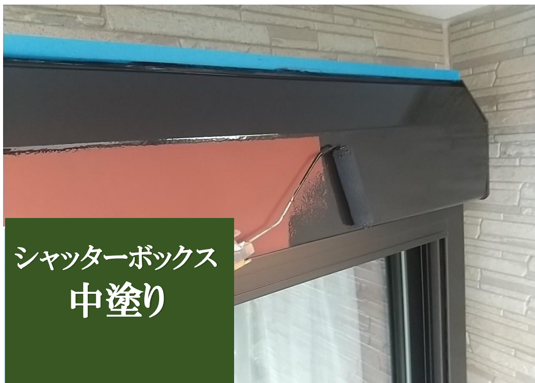
シャッターボックス 中塗り