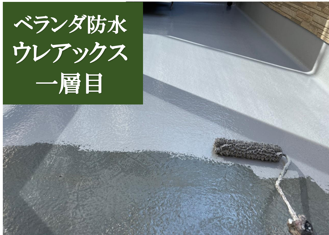
ベランダ防水 ウレアックス 一層目