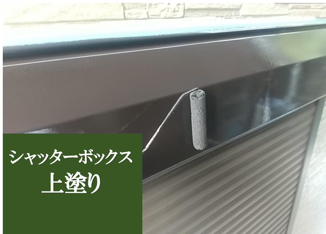
シャッターボックス 上塗り