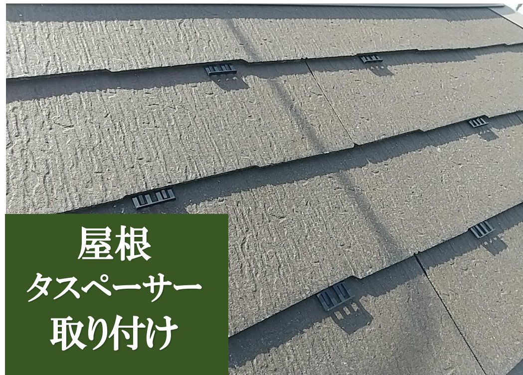
屋根 タスペーサー 取り付け