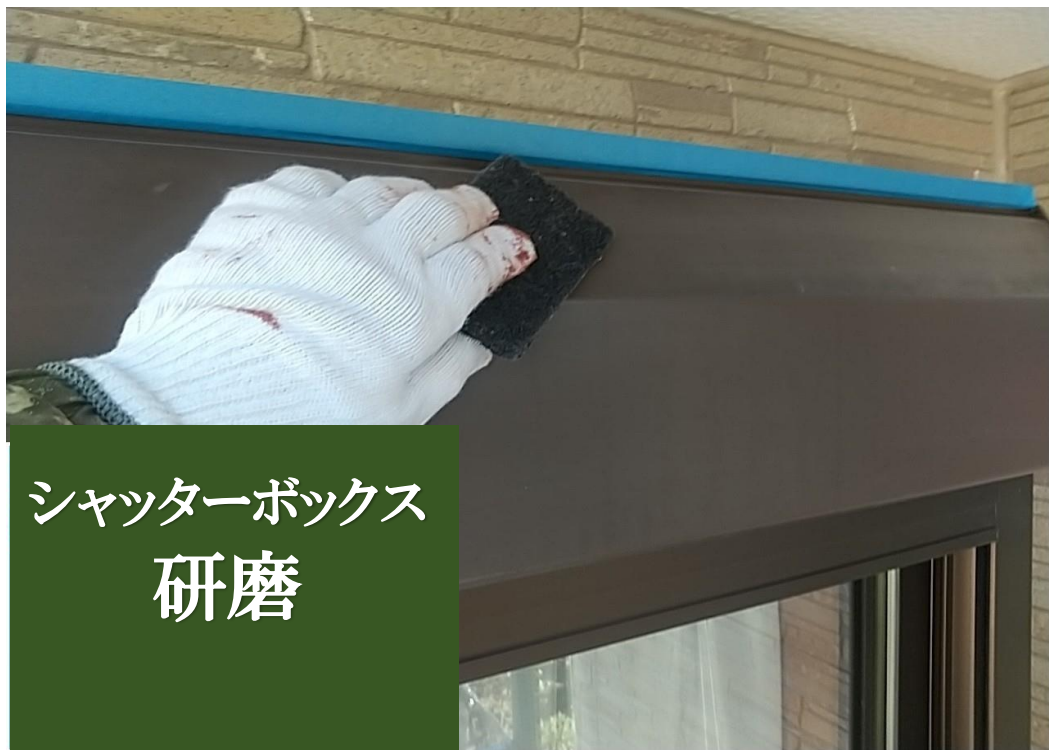
シャッターボックス 研磨