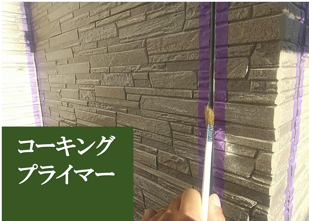
コーキング プライマー