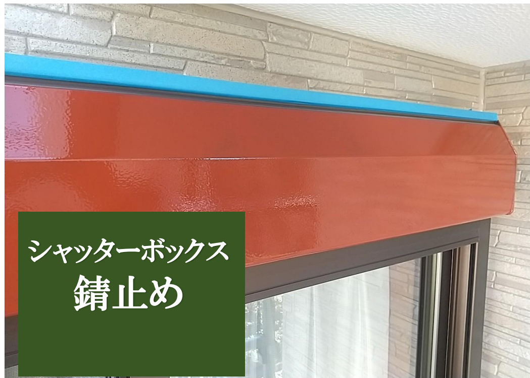
シャッターボックス 錆止め