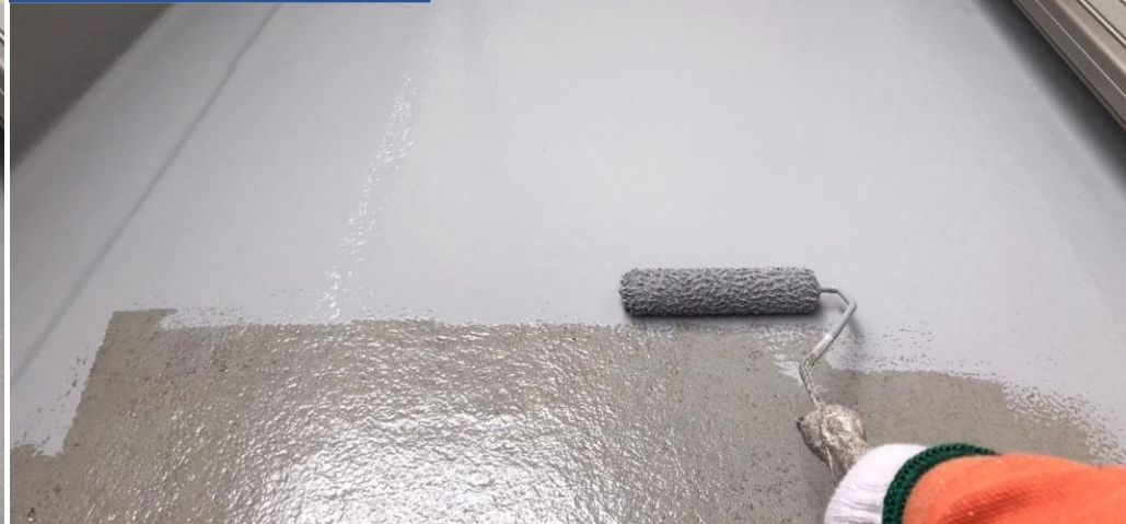
ベランダ防水 ウレアックス 一層目