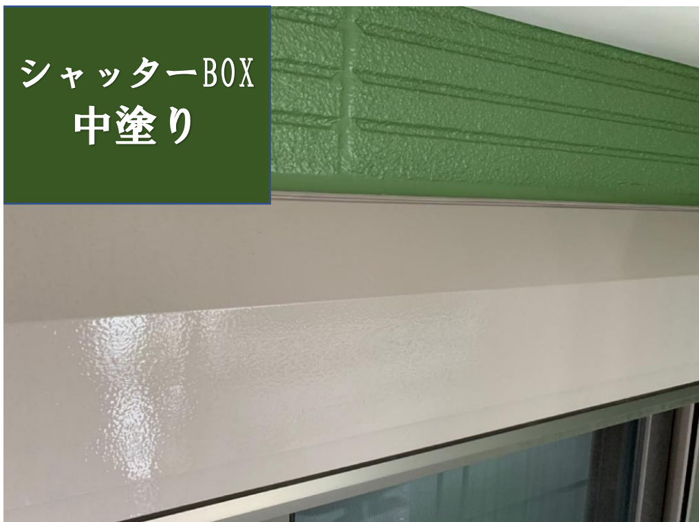
シャッターBOX 中塗り