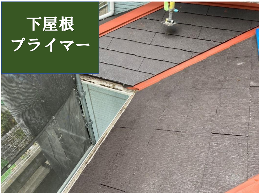
下屋根 プライマー