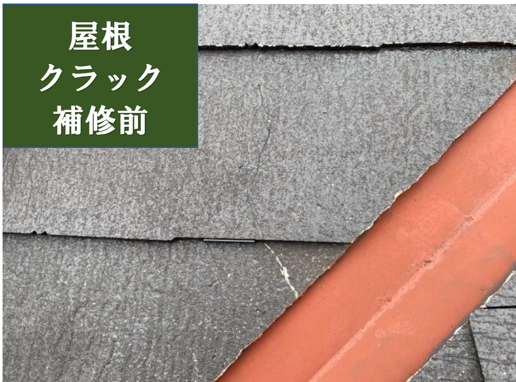
屋根 クラック 補修前