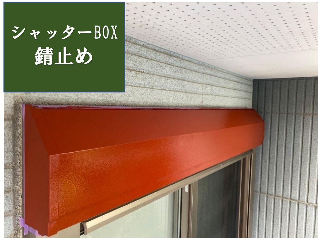
シャッターBOX 錆止め