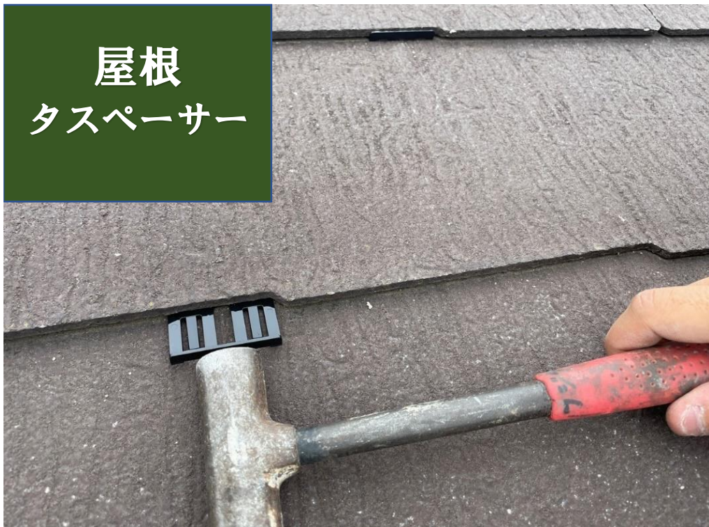
屋根 タスペーサー