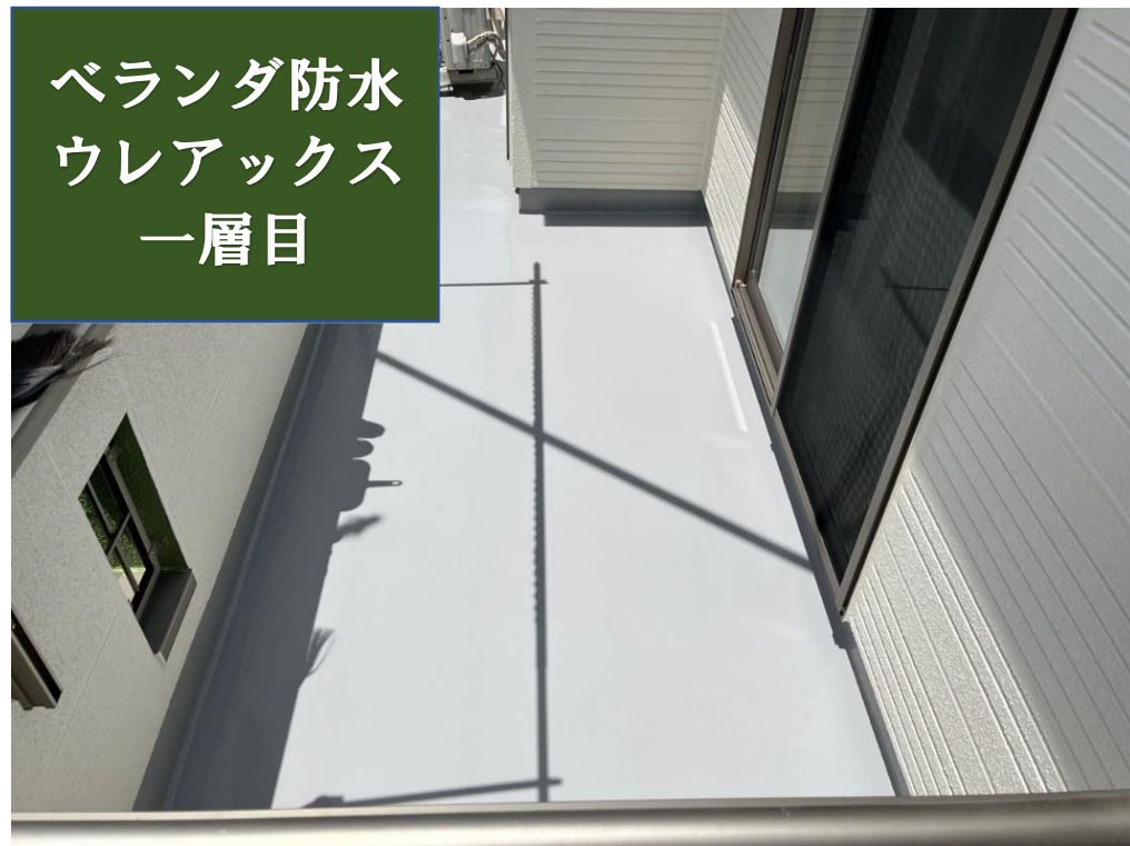
ベランダ防水 ウレアックス 一層目