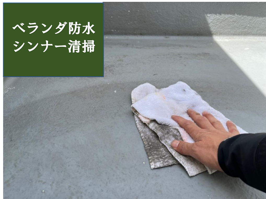
ベランダ防水 シンナー清掃