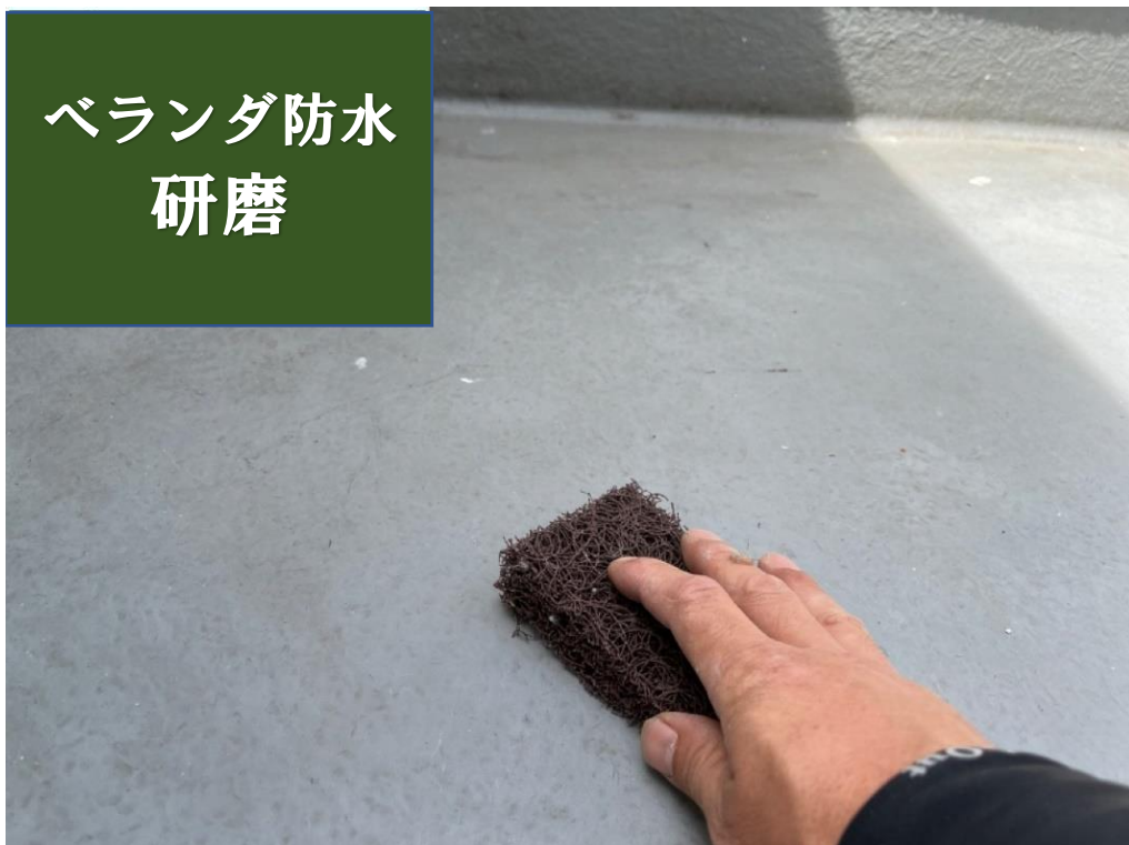
ベランダ防水 研磨